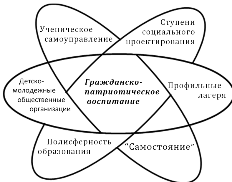
Рис. 1. Маршруты проявлений гражданских компетенций

В концепции духовно-нравственного воспитания механизм воспитания прописывается так: формирование сознания + приобретение опыта = получение навыка. Мы считаем, что всё идёт от чувств: старшеклассник, включаясь в деятельность, начинает задумываться о вариантах выбора. Появляются разные варианты – идёт этап осмысления, приводящий к проявлению гражданских компетенций через маршруты.