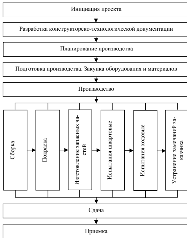
Рис. 3. Жизненный цикл проекта в области судостроения

В настоящее время наибольшей популярностью на предприятиях судостроения и судоремонта в России пользуются программные продукты Oracle Primavera [3], Enovia, WindChill, SAP, AVEVA ERM Plant, EXEPRON, IFS Application for Shipbuilding, т.к. они удовлетворяют ряду требований: